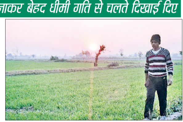
जींद। खेत को संभालने पहुंचा किसान।

वाहन चालक एक-दूसरे के पीछे कतार बनाकर बेहद धीमी गति से चलते दिखाई दिए। खासकर कैथल-पटियाला मुख्य मार्ग पर वाहन चालकों को अतिरिक्त सावधानी बरतनी पड़ी। ठंड और कोहरे का सबसे ज्यादा असर स्कूली बच्चों पर देखने को मिल रहा है। सुबह के समय ठंड अधिक होने के कारण बच्चों को स्कूल जाने में भारी दिक्कतों का सामना करना पड़ रहा है। हालांकि प्रदेश सरकार की ओर से एक जनवरी से 15 जनवरी