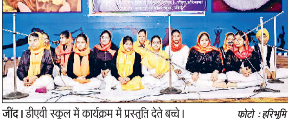
जींद। डीएवी स्कूल में कार्यक्रम में प्रस्तुति देते बच्चे।

चाहिए। गुरु तेग बहादुर का बलिदान मानवता, धर्म, स्वतंत्रता और सत्य की रक्षा के लिए दिया गया वह सर्वोच्च उदाहरण है। जिसकी तुलना दुनिया में कहीं नहीं मिलती। हरियाणा सरकार संत, महापुरुषों की शिक्षाओं को जन-जन तक पहुंचाने के लिए निरंतर कार्य कर रही है। सरकार का उद्देश्य समाज में भाईचारा, आपसी सद्भाव और सांस्कृतिक मूल्यों को मजबूत करना है। ऐसे स्मारक और द्वार इतिहास को सहेजने के साथ-साथ युवाओं को अपने गौरवशाली अतीत से परिचित कराते हैं। गुरु तेग बहादुर ने धर्म, संस्कृति और