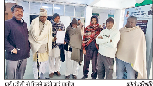
पाई। डीसी से मिलने पहुंचे पाई ग्रामीण।

में प्रश्नोत्तरी प्रतियोगिता करवाई गई। जिसमें प्रथम स्थान पाने वाले छात्र, छात्राओं को और उच्च स्तरीय के मुखियाओं को सम्मानित किया गया। जिन्होंने इस प्रतियोगिता में भाग लिया था।