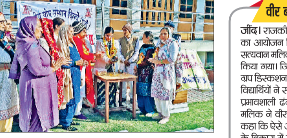
जीद। नारी शक्ति दिवस पर कार्यक्रम में भाग लेते हुए।