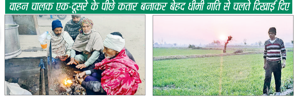
सीवन। सर्दी से बचने के लिए अलाव का सहारा लेते लोग।