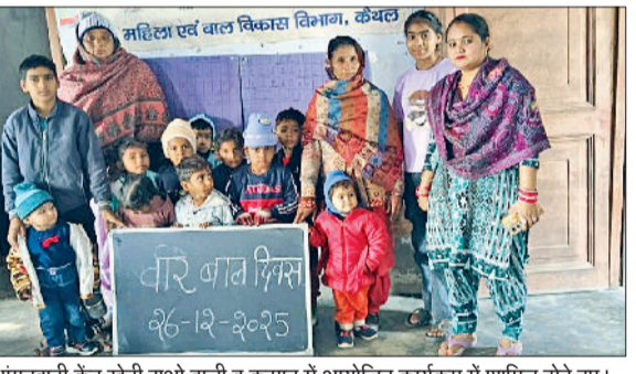
आंगनवाड़ी केंद्र खेड़ी राओ वाली व कसान में आयोजित कार्यक्रम में शामिल होते हुए।