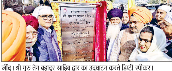
जींद। श्री गुरु तेग बहादुर साहिब द्वार का उद्घाटन करते डिप्टी स्पीकर।