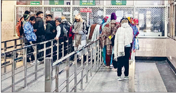
जींद। नागरिक अस्पताल में दवा के लिए लगी लाइन व इमरजेंसी वार्ड में उपचार करते चिकित्सक।