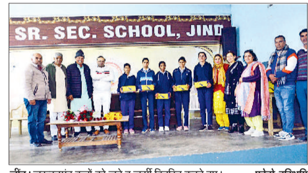
जीद। जरूरतमंद बच्चों को जूते व जर्सी वितरित करते हुए।

स्वास्थ्य प्रबंधन, संतुलित आहार, टीकाकरण, स्वच्छ दुग्ध उत्पादन एवं नवीन पशुपालन योजनाओं की जानकारी दी गई। साथ ही किसानों से अपील की गई कि वे प्रांत के सभी पशु विज्ञान केंद्र द्वारा दी जा रही सेवाओं और प्रशिक्षण कार्यक्रमों का अधिक से अधिक लाभ उठाएं। कार्यक्रम में 50 किसानों ने भाग लिया।