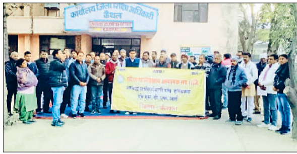
कैथल। डीईओ कार्यालय पर धरना देकर नारेबाजी करते अध्यापक।

ठंडी और शुष्क हवा के कारण त्वचा से प्राकृतिक तैलीय कण कम हो जाते हैं। ठंडी हवा से त्वचा के तेल कम हो जाते हैं। कमरे में हीटर या ब्लो-आर का उपयोग, जो हवा को और शुष्क बनाता है। धूप और कम नीड का अत्यधिक प्रयोग से त्वचा के सरल उपग्रह नष्ट होने के तुरंत बाद रोजाना अच्छा मॉइस्चराइजर जेली, क्रीम लगाएं। गुनगुने पानी से नहाएं, ज्यादा गर्म पानी से बचें। धूप से बचें। धूप और हार्डवेयर से बचें। ठंडी हवा से बचाव के लिए पूरे शरीर को ढक कर निकलें। संतुलित आहार लें, जिसमें विटामिन ए, सी और ई से भरपूर चीजें शामिल हों। स्वास्थ्य विशेषज्ञों का कहना है कि अगर समस्या गंभीर हो तो तुरंत चर्म रोग विशेषज्ञ से संपर्क करें।