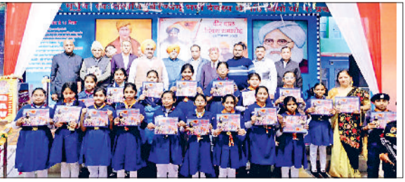
जीद। कार्यक्रम में मौजूद बच्चे।