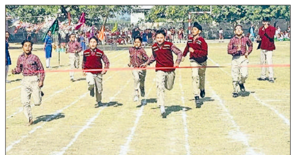
कैथल। खेलों में दमखम दिखाते ओएसडीएवी स्कूल के विद्यार्थी।