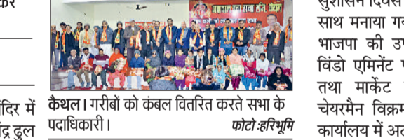
कैथल। गरीबों को कंबल वितरित करते सभा के पदाधिकारी।