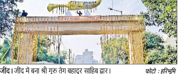
जींद। जींद में बना श्री गुरु तेग बहादुर साहिब द्वार।