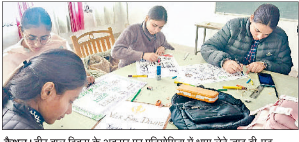
कैथल। वीर बाल दिवस के अवसर पर प्रतियोगिता में भाग लेते जाट बी.एड. कॉलेज के छात्र-छात्राएं।