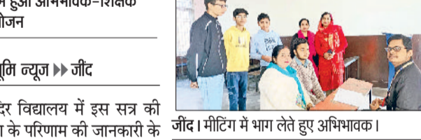
जींद। पीटीएम में भाग लेते हुए अभिभावक।